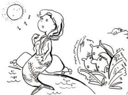
legenda o warszawskiej syrence