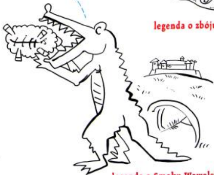
legenda o Smoku Wawelskim