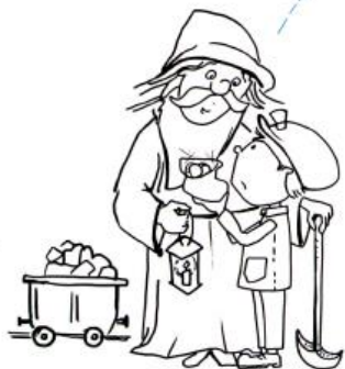
legenda o Skarbniku