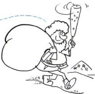
legenda o zbójcu Madeju