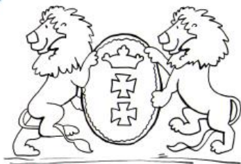
legenda o lwach z gdańskiego ratusza