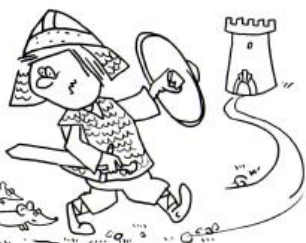
legenda o Popielu